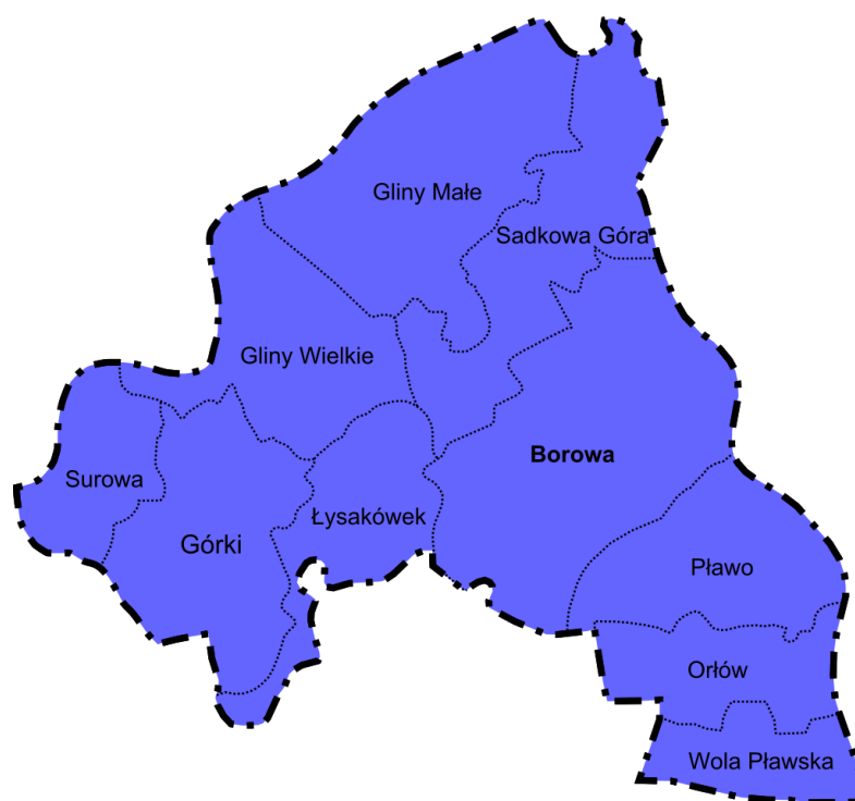
Rys 1. Sołectwa wchodzące w skład Gminy

Pod względem administracyjnym Gmina podzielona jest na 10 sołectw będących jednostkami pomocniczymi w rozumieniu art. 5 ustawy z dnia 8 marca 1990 r. o samorządzie gminnym.